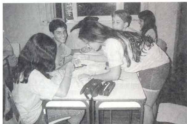
Alunos de 7ª Série empregando material concreto na descoberta do número irracional \pi (pi)