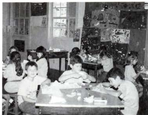
Vejam, estão nascendo vários coelhinhos de dobradura