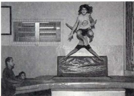
Ginástica Olímpica - Saltando Alto!

1. “O mais importante é fazer os deveres de casa e mais legal são as Artes.”