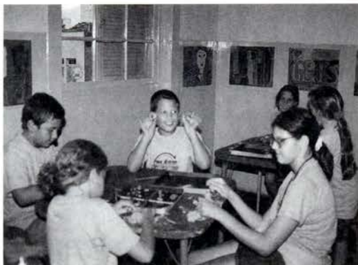
Artes: A expressão da criatividade

3. “O TICC me ajuda nos estudos e em todo meu desempenho escolar.”