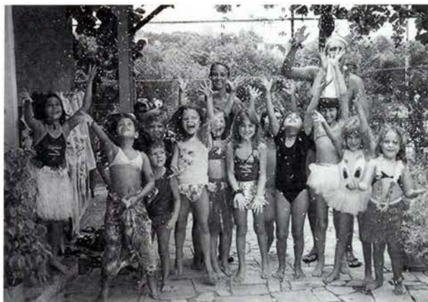
Carnaval aquático: A festa da alegria!