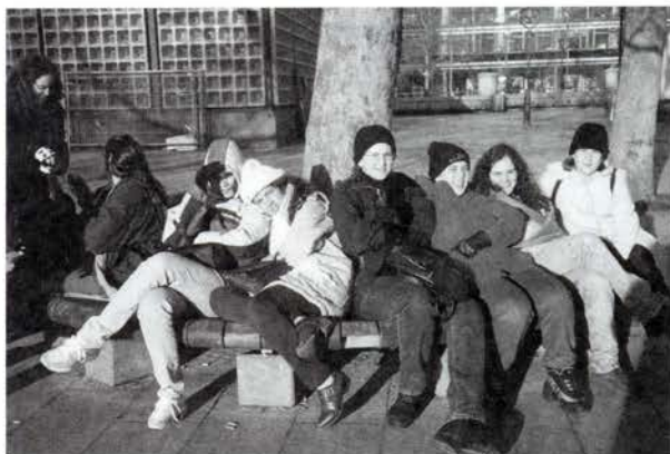
Die Gruppe "sonnt sich" in der Fußgängerzone

Die Leute in Stuttgart waren sehr sympatisch und hatten viel Geduld mit uns. Alles war neu für uns: die Schule, die Leute, die Verkehrsmittel, die Orte und natürlich das Wetter, weil es sehr kalt war. Aber das war kein Problem für uns. Wir haben viele Sachen gemacht, die wir hier auch machen, wie ins Kino und in die Disco fahren. Nach einer Woche konnten wir schon allein ins Zentrum fahren, deshalb waren wir jeden Tag nach der Schule auf der Hauptstraße und in der Fußgängerzone. Aus diesem Grund können wir diese Tage, an denen wir auf der Königsstrasse waren und im Mc`Donalds gegessen haben, nicht vergessen.