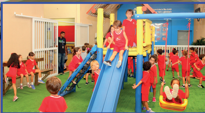
A quadra do Cruzeiroinho recebeu nova pintura e iluminação.

N a unidade Centro do Colégio Cruzeiro, o espaço onde fica localizado o Cruzeiroinho passou por melhorias nas instalações e obras de renovação. A área, que é destinada às turmas do Maternal II ao 1º ano do Ensino Fundamental, foi modernizada a partir do término do ano letivo de 2018 e teve sua reinauguração oficial em maio de 2019. O projeto faz parte de uma iniciativa da Sociedade de Beneficência Humboldt, mantenedora do Colégio Cruzeiro, e da Direção da unidade, visando fortalecer os propósitos educacionais da Instituição e promover melhorias constantes nas instalações das unidades.