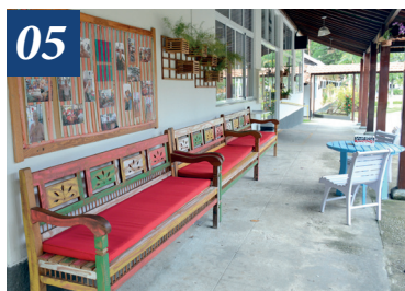
Melhorias no Retiro Humbolt