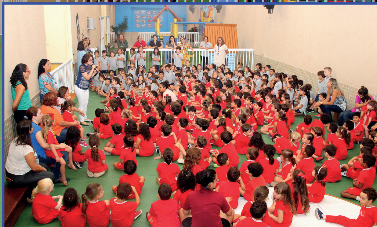
Desde maio de 2019, os alunos da Educação Infantil e do 1º Ano do Ensino Fundamental desfrutaram de novas instalações no Cruzeiroinho. O local é usado para eventos, aulas de Educação Física e atividades pedagógicas.

Sociedade de Beneficência Humboldt COLÉGIO CRUZEIRO CRUZEIRINHO