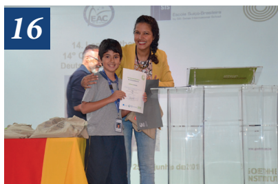
Concurso de Leitura da Língua Alemã