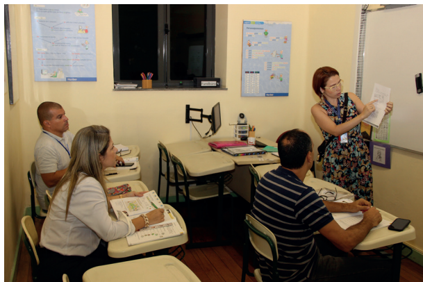
Aulas dos cursos de Alemão para Pais e para Colaboradores nas unidades Centro e Jacarepaguá, respectivamente.