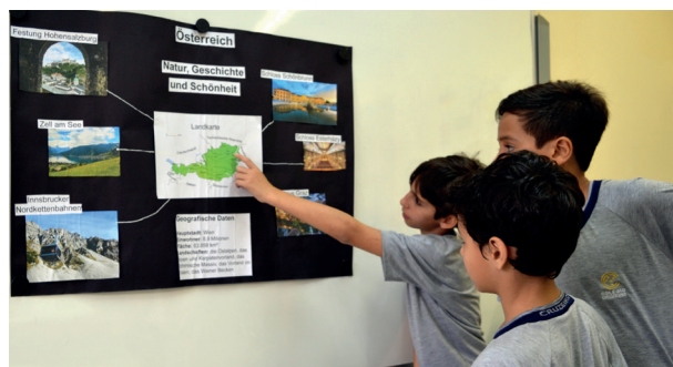
Ao longo da Semana da Língua Alemã foram organizadas atividades como Soletrando em Alemão, Trava-Línguas, Quiz, Debate e Exposição de trabalhos.