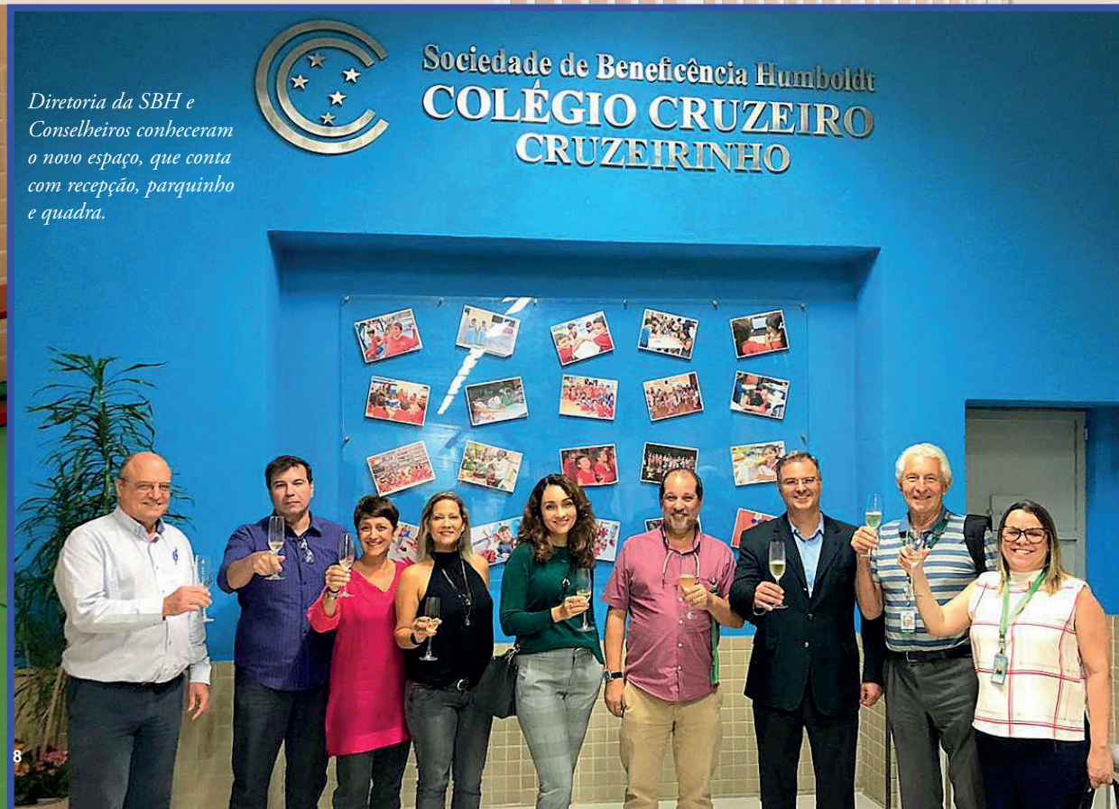
Diretoria da SBH e Conselheiros conheceram o novo espaço, que conta com recepção, parquinho e quadra.